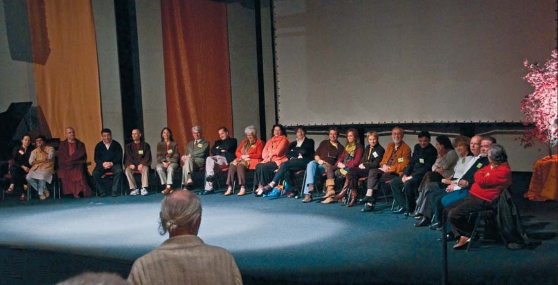
Quelques images du Forum 2008...